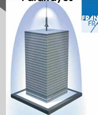
Sistemas de Pararrayos