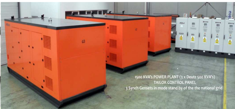
1500 KVA's POWER PLANT (3 x Deutz 500 KVA's) TAILOR CONTROL PANEL 3 Synch Gensets in mode stand by of the the national grid