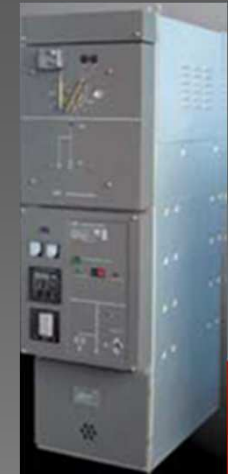
Celdas Media Tensión