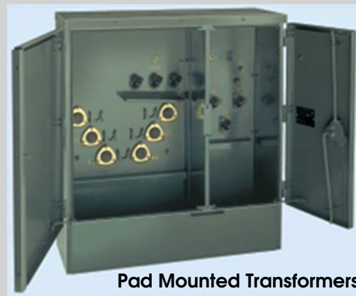
Pad Mounted Transformers